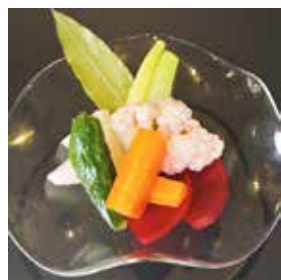
有機野菜のピクルス