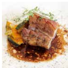
沖縄まーさん豚バラのやわらか煮

真空パックにてお持ち帰り頂きます。 メイン料理は湯せんで4分温めて頂くと 美味しくお召し上がりいただけます。 詳しくは、スタッフまでお声掛けください。