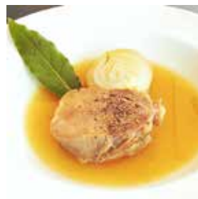
イタリア産仔牛タンのポリート