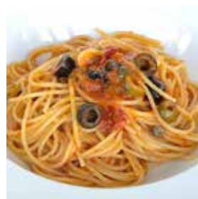
ブッタネスカ風トマトソース