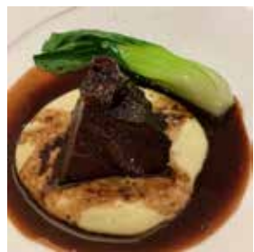
和牛ホホ肉の赤ワイン煮