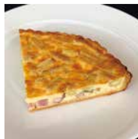
本日のキッシュ 1/4 カット